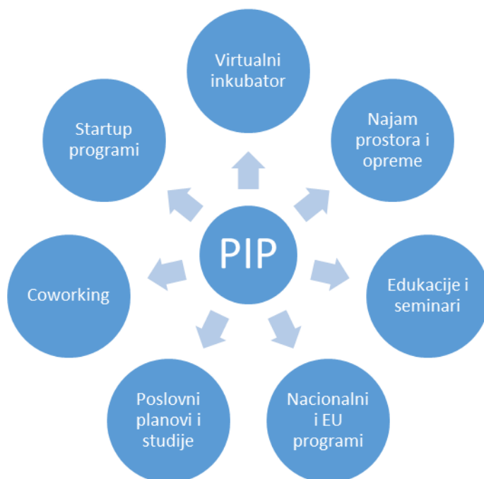
Slika 2. Struktura djelatnosti

postojećih poduzeća. U nastavku je obrazloženo 7 glavnih planiranih djelatnosti PIP-a koje će biti financirane programom.